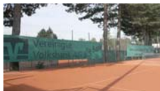
Blende groß, Außenanlage